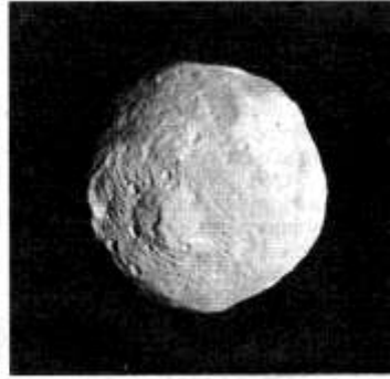
El asteroide Vesta, casi un planeta enano.

Dawn será la primera sonda creada por el ser humano en entrar en contacto con uno de los cuerpos de mayor tamaño del cinturón de asteroides. Al gravitar alrededor de Vesta, podrá to-